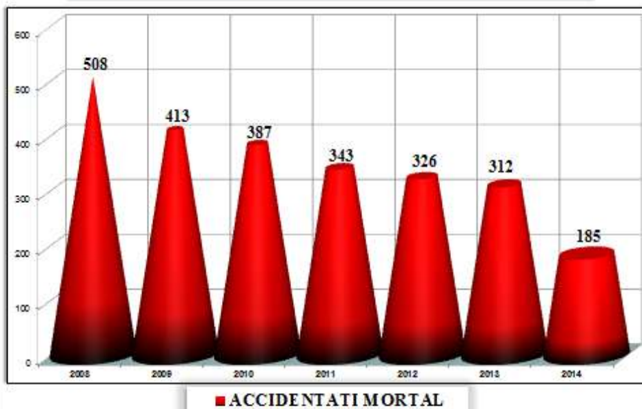
EVOLUȚIA ACCIDENTAȚILOR MORTAL ÎN MUNCĂ PE ANI DE PRODUCERE